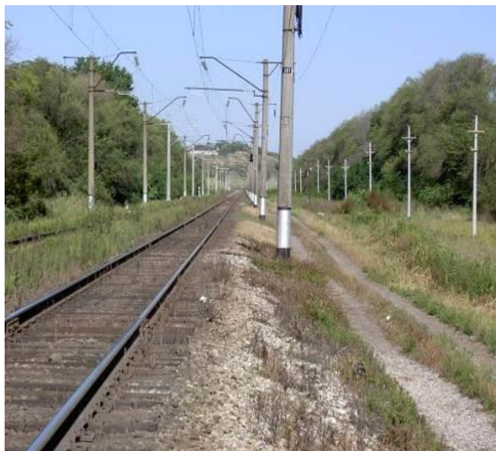
Через 35 дней после обработки