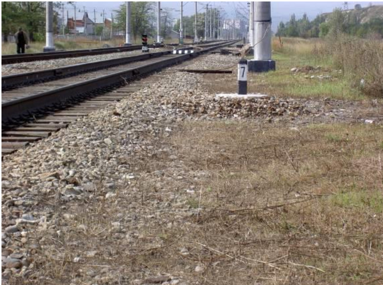
Фото 3. Эффективность гербицида Грейдер, ВГР 5 л/га через 35 дней после обработки Дата проведения обработки 07.08.2009 г. Станция Подкумок, Северо-Кавказская ЖД.