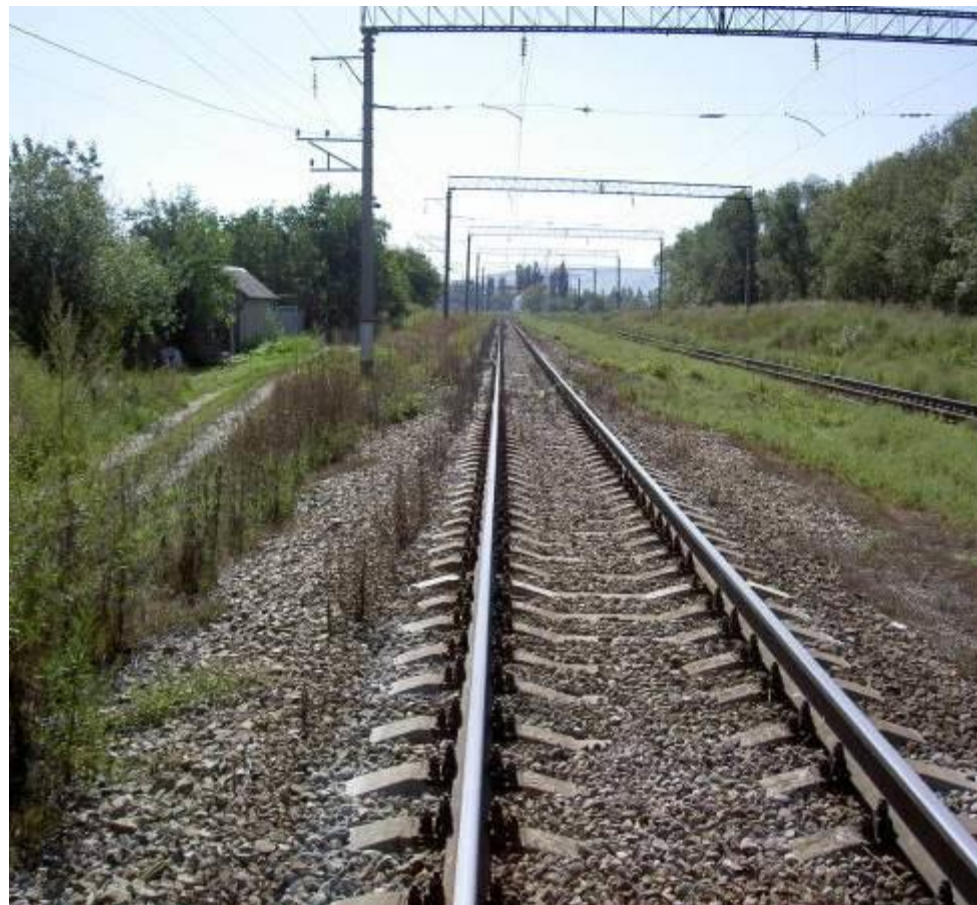
через 30 дней после обработки