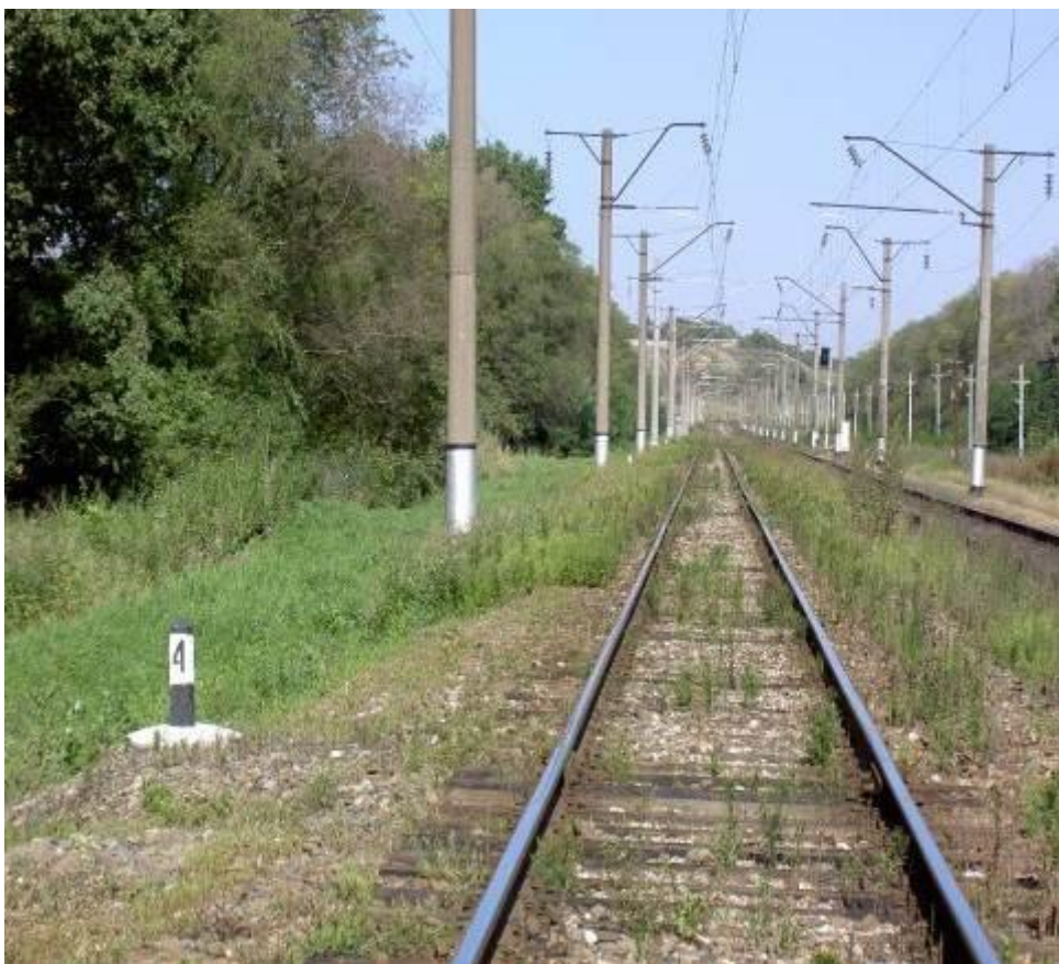
Контроль (без обработки)