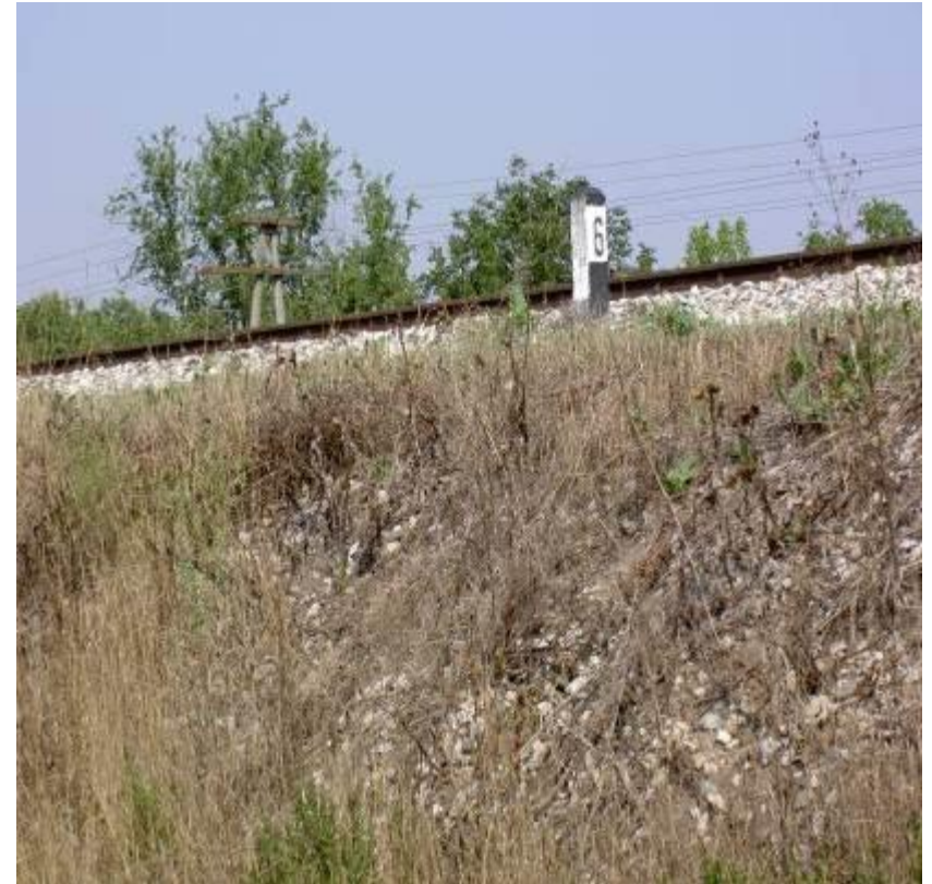
через 35 дней после обработки